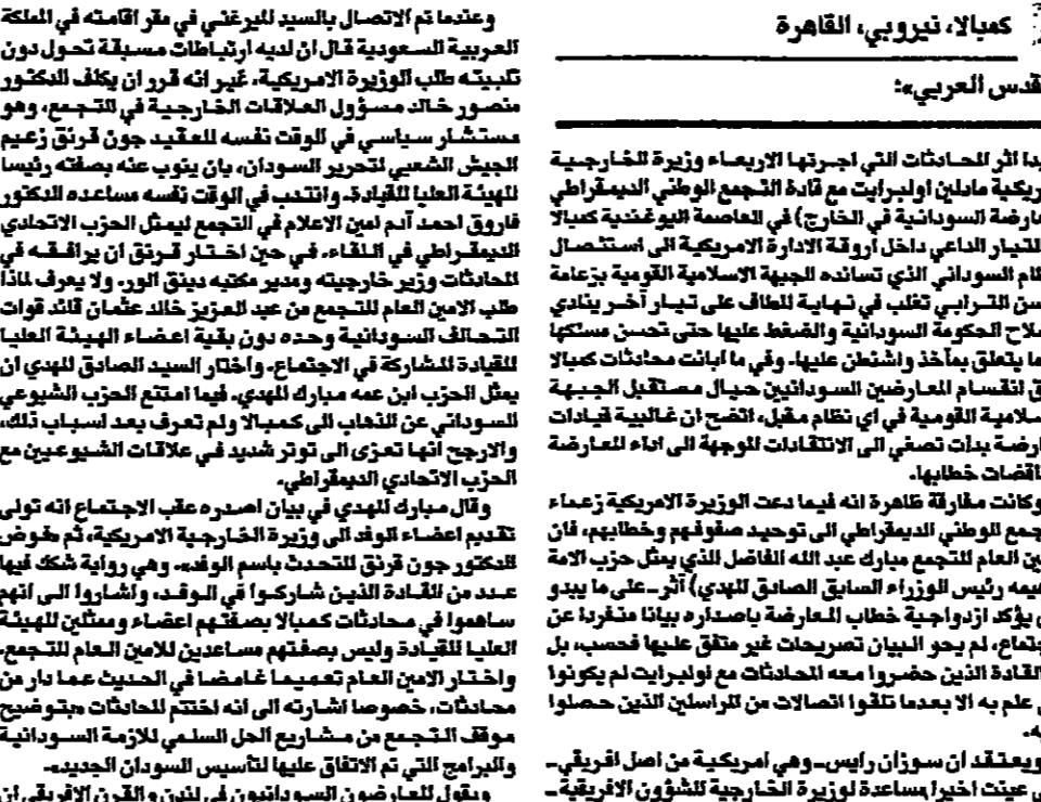
جان فون كويغلي

وقد تم الاتصال بالسيّد البرقي في مقر إقامته في المنكّة العربية السعودية قال إن لديه ارتباطات مسبقة تحول دون تكميحه طلب الويزة الأمريكية. غير أنه قرّر أن يكلف الدكتور منصور خالد مسؤول العلاقات الخارجية للتجمع، وهو مستشار سياسي في الوقت نفسه للعقيد جون فون كويغلي، ليجيش الضمّي لتحرير السودان، بأن يتوجه بسفارة رئيسا للوفد الطليق للقيادة، والتعب في الوقت نفسه مساعده الدكتور فون كويغلي في التفاوض مع الحكومة السودانية. وقد وافقت منظمة المؤتمر الإسلامي على عقد مؤتمر دولي حول الإرهاب، وذلك في إطار الجهود المبذولة من قبل المنظمة للتصدي للتهديدات الإرهابية.